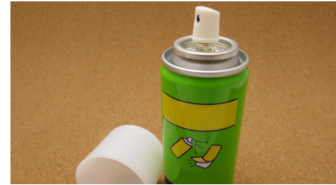
中身の入ったスプレー缶・消火器