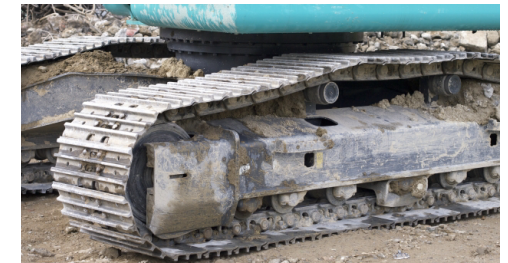
重機等のキャタピラ