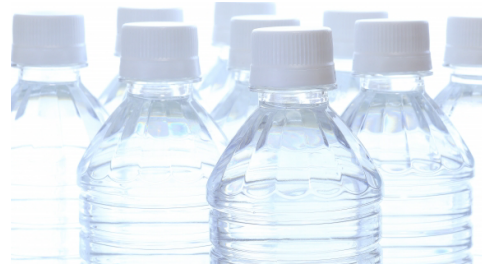
中身の入ったペットボトル・液体