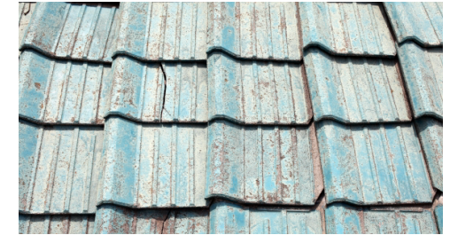
スレート等の石綿含有品