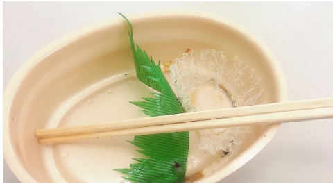
弁当かす・食品残渣