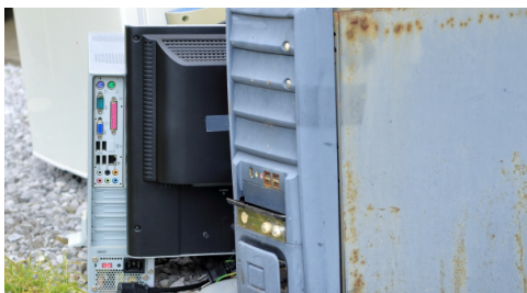
パソコン・エアコン等のリサイクル家電